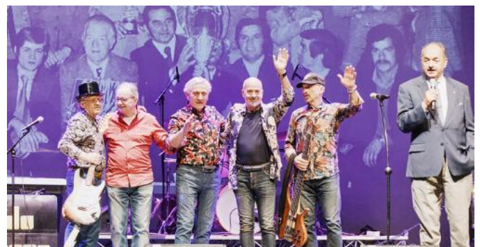
Il saluto finale