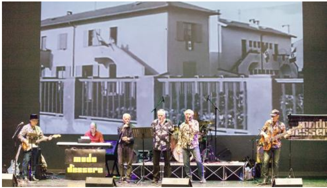
Il gruppo musicale "Modo d'essere"