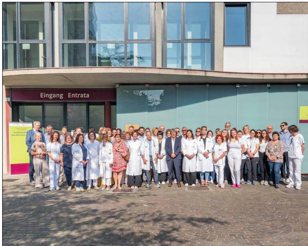
Inaugurazione della nuova Casa della Comunità Loew-Cadonna a Bolzano

Già si sta delineando per gli Ambulatori delle Piccole Urgenze (APU), presso le Case della Comunità, l'inevitabile necessità di assumere medici privi di formazione specifica e/o competenze bilingui e questo mina sul nascere la qualità dell'assistenza e rischia di pregiudicare