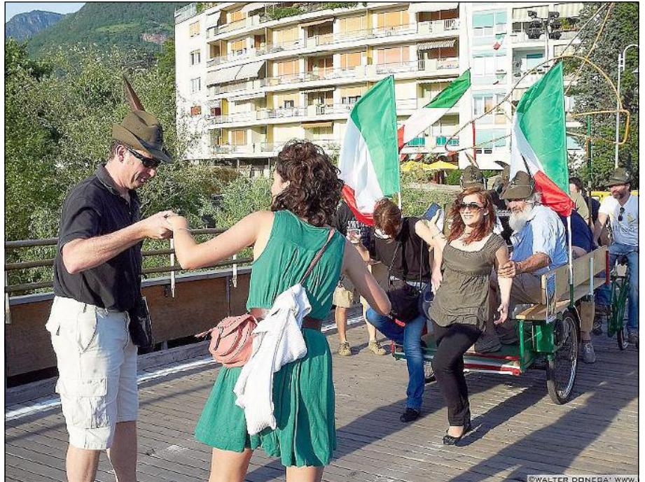
Adunata nazionale Alpini 2012 Bozen: Sehen so Siegesdenkmal-Pilger aus?

Und dann erzählte ich ein Geschichtchen. Es gab Widerstände und fadenscheinige Begründungen: Es würde ein „Marsch auf Bo-